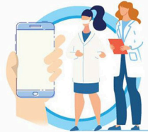
В СЛУЧАЕ ЗАБОЛЕВАНИЯ ОБРАЩАЙТЕСЬ К ВРАЧУ