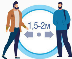
СОБЛЮДАЙТЕ РАССТОЯНИЕ И ЭТИКЕТ