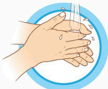
ЧАСТО МОЙТЕ РУКИ С МЫЛОМ